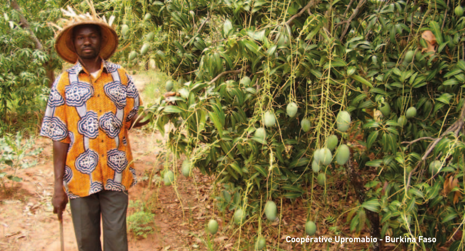
Coopérative Upromabio - Burkina Faso